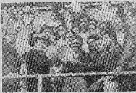
El Licenciado don Mario Echandi J., hace entrega del Trofeo obsequiado por don Otilio Ulate al vencedor al terminar el juego entre los poderosos equipos "Municipal" de Guatemala y Alajuelense de Costa Rica, con el triunfo del primero, el 12 de los corrientes, nuestro Redactor presenciando el acto.

Se efectuó en el Estado Nacional el encuentro de los equipostrellas "Municipal" de Guatemala y "Universidad" de Costa Rica, resultando un score de 4 tantos a favor del equipo local por 3 a favor del equipo visitante. Este evento tuvo lugar con asistencia de gran público y el juego desarrollóse bastante deslucido y falta de emoción, contrastando con los efectos de los días anteriores en que demostrara enorme interés y emotividad la afición costarricense. Con ocasión de estos juegos, se llevó a cabo el acto de entrega del trofeo ofrecido por el Presidente Electo don Otilio Ulate Blanco al equipo "Municipal" de